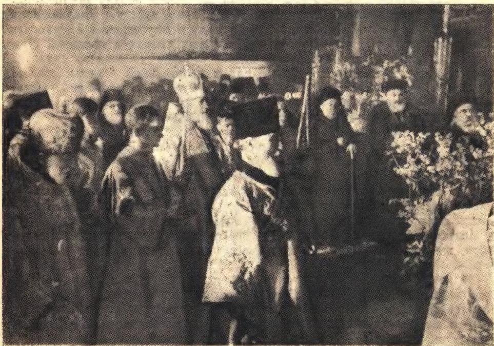
Святейший Патриарх Алексий совершает панихиду у могилы покойного Святейшего Патриарха Сергия 5 февраля 1945 г.

ДИМИТРИЙ, АРХИЕПИСКОП РЯЗАНСКИЙ И КАСИМОВСКИЙ